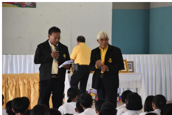
ร่วมด้วยช่วยกัน...วิทยากรผู้ทรงคุณค่า