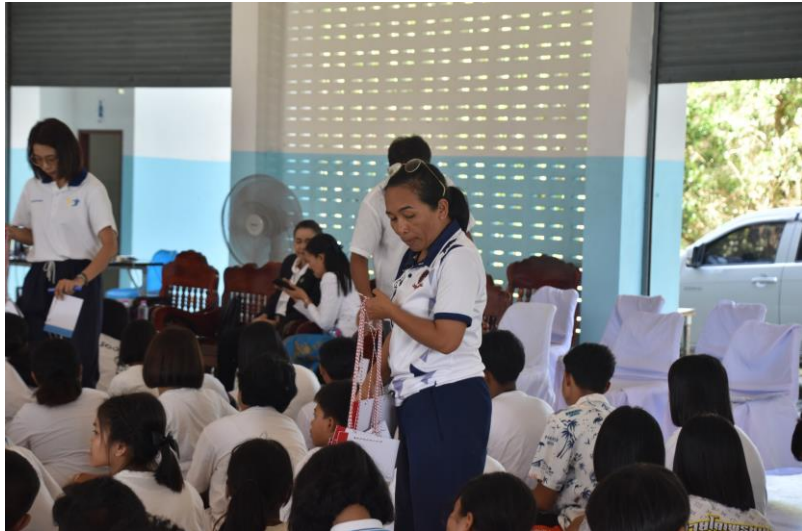
คุณครูแจกป้ายชื่อพร้อมสมุดบันทึกให้นักเรียน